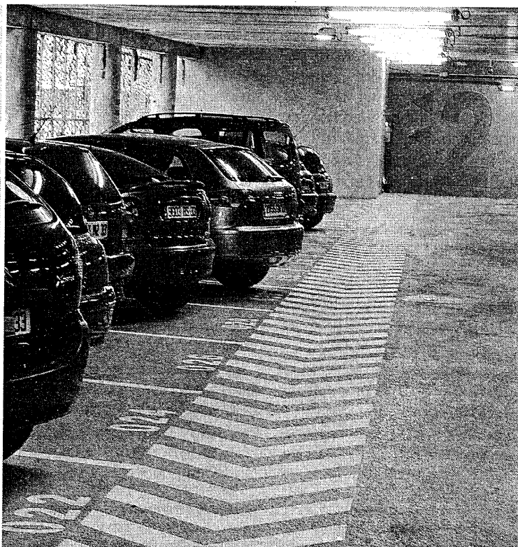
Son habillage métallique rappelle les moucharabieh d'Afrique du nord. 404 places sont réparties sur quatre niveaux