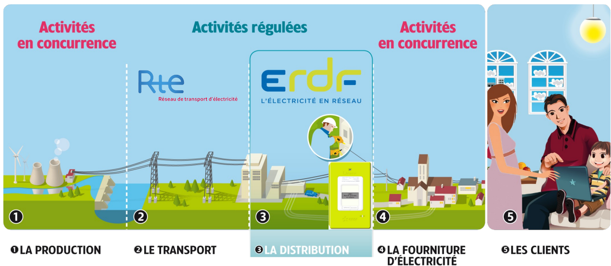
Schéma de fonctionnement :